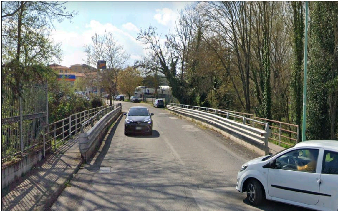
Scatto fotografico n°11