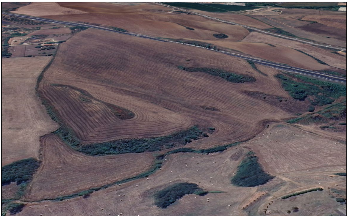
Scatto fotografico n°2