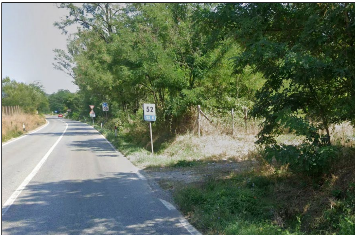
Scatto fotografico n°5