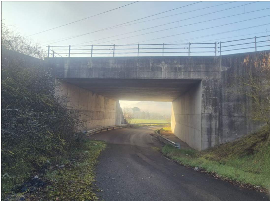
Scatto fotografico n°3