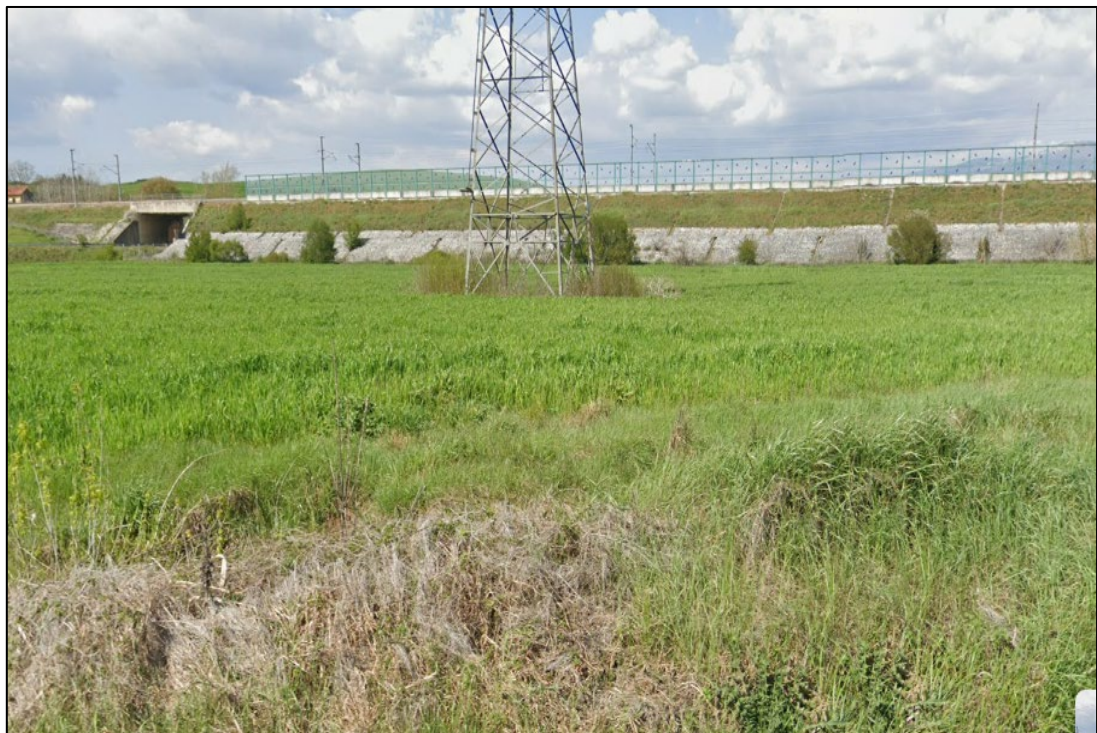
Scatto fotografico n°4