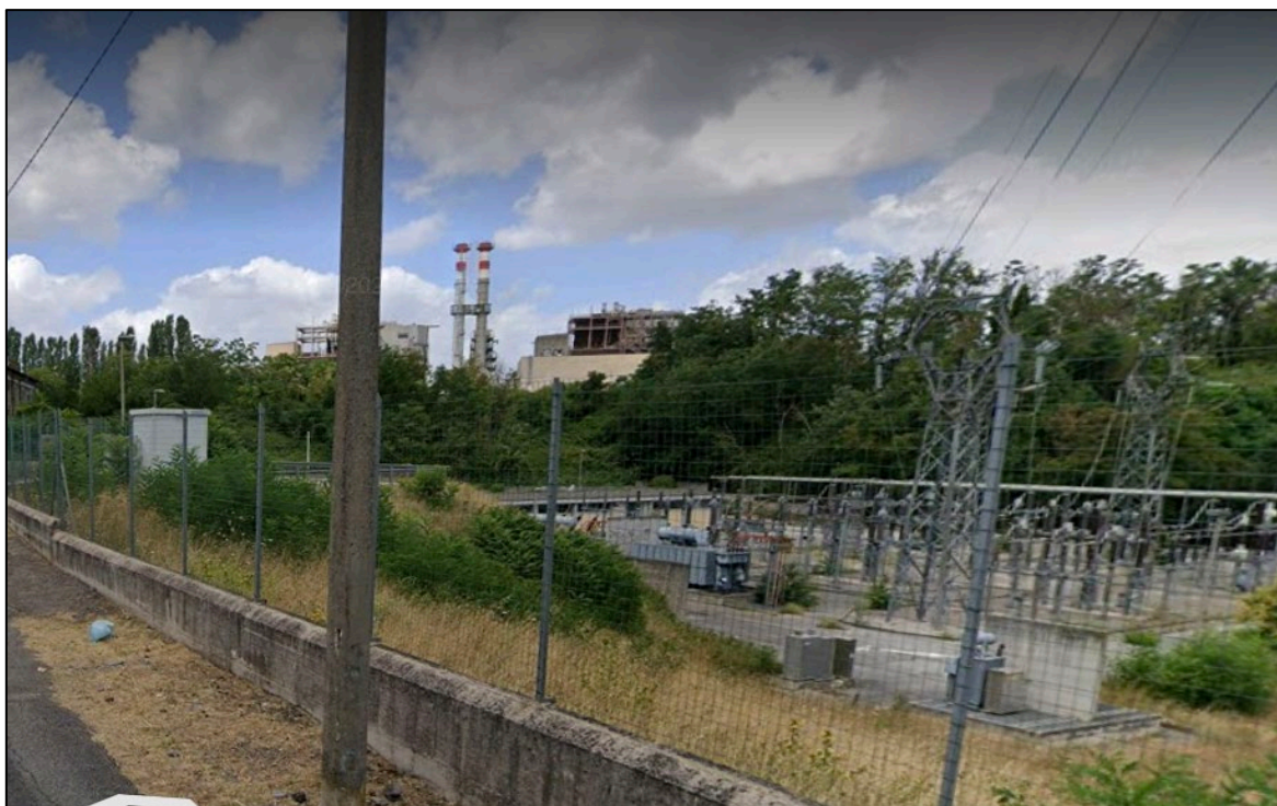
Scatto fotografico n°13