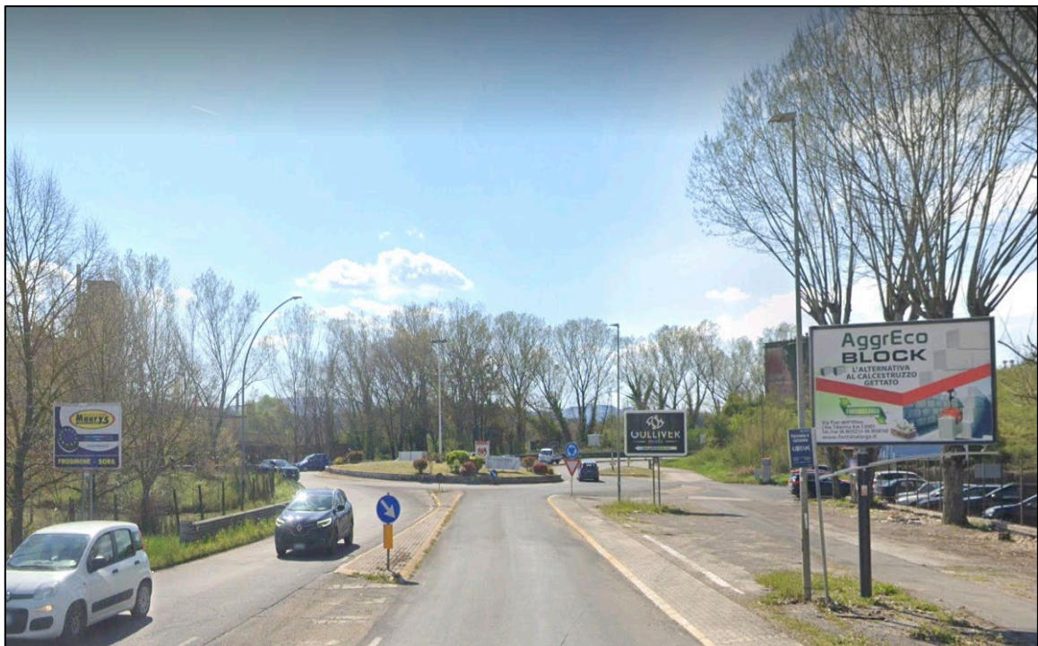
Scatto fotografico n°10