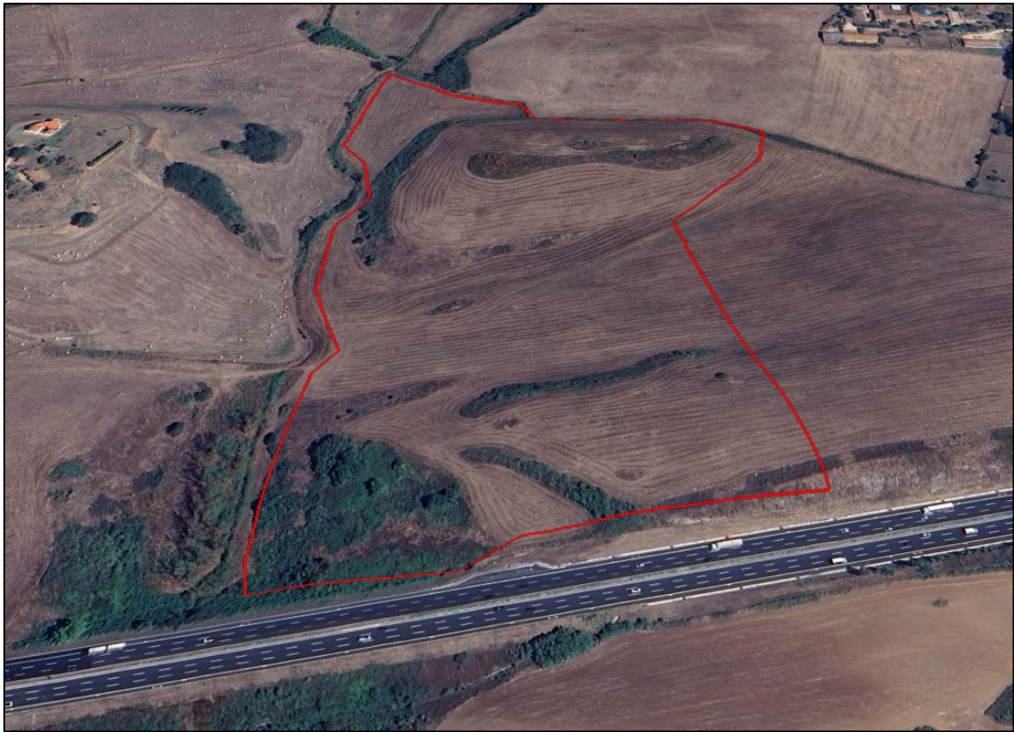
Scatto fotografico n°1