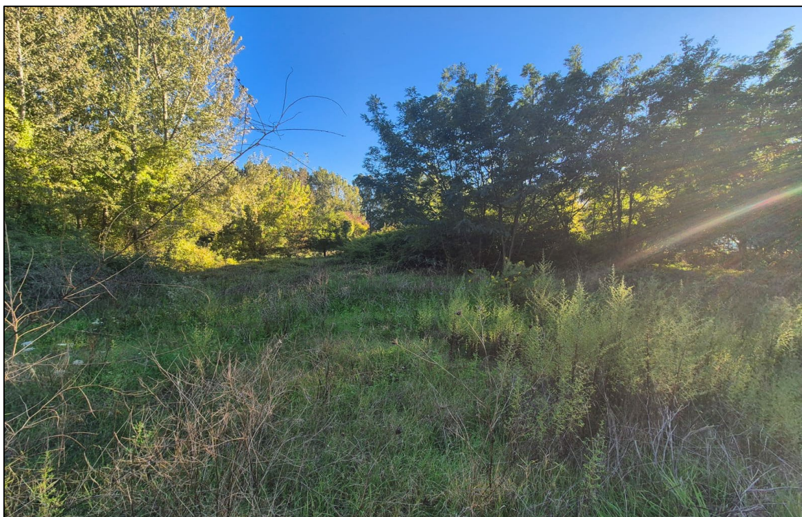
Scatto fotografico n°7