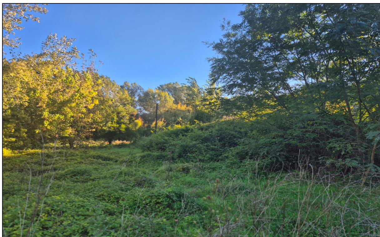
Scatto fotografico n°6