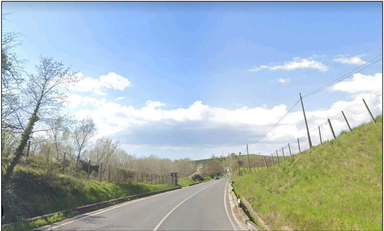
Scatto fotografico n°9